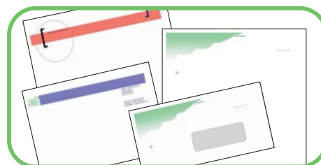
Papiers en-tête et enveloppes.

Contactez Benoît FOURQUET au 05 65 61 57 97 bfourquet@dataforms.fr